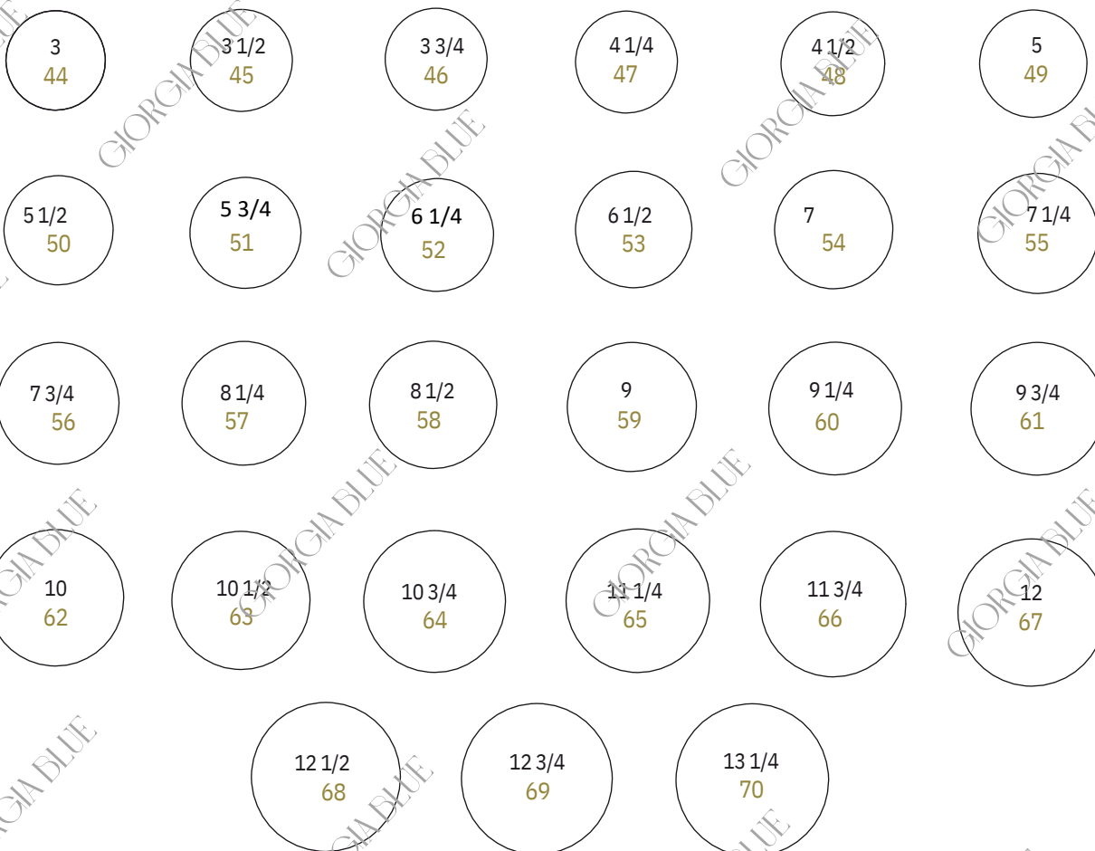
GRÁFICO DE CONVERSÃO*

*Somente para REFERÊNCIA. A Giorgia Blue não se responsabiliza por erros que ocorrerem em decorrência da medição do seu dedo.